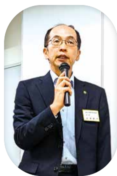
岩瀬県税事務所長