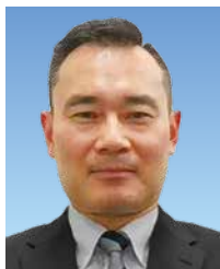
二野 1 統括